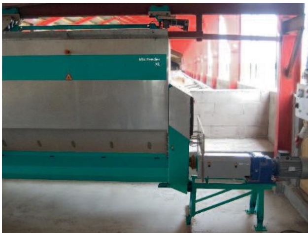
Plany żywieniowe dla każdej grupy zwierząt: świeża pasza we wszystkich strefach czystego stołu paszowego