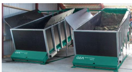
2 | Mix Feeder – The right choice.

Miejsce w najmniejszej oborze: nakład pracy zredukowany do uzupełniania zasobników